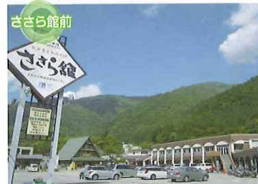
ささら館前 道の駅上平 ささら館 五箇山ならではの特産品・お土産を多数取り揃えています。また、岩魚料理をはじめ、山菜そばや五箇山豆腐など、絶品料理も気軽に味わえます。