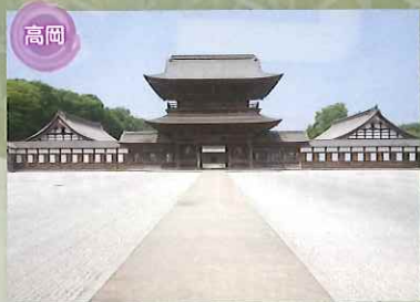
高岡 国宝 高岡山 瑞龍寺 加賀藩二代藩主前田利長公の菩提を弔うため、三代藩主利常公によって建立された曹洞宗の寺院で、総門、禅堂、大庫裏、大茶室、回廊三棟が重要文化財として指定されており、江戸初期の禅宗寺院建築として高く評価されています。