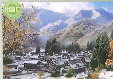
相倉口 世界遺産 相倉合掌造り集落 今も20棟以上の合掌造り家屋が現存し、生活が営まれていて、集落と周りの環境が織りなす美しい風景を目の当たりにすることができます。季節ごとに行われるライトアップは必見! 幻想的な空間に心奪われます。