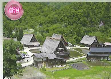
菅沼 世界遺産 菅沼合掌造り集落 旧上平村のほぼ中央にある小さな集落。合掌造り家屋9棟をはじめ、土蔵や板倉などの伝統的な建物、雪持林や茅場などの山林をも含めた地域が史跡に指定されています。