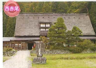
西赤尾 国指定重要文化財 岩瀬家 南砺市西赤尾にあり、約300年前に建てられた五箇山地域最大規模の合掌造り、総ケヤキ造りの準5階建て家屋です。