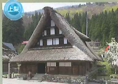
上梨 国指定重要文化財 村上家 南砺市上梨にあり、約400年前の建築当時の様式を伝える貴重な合掌造り家屋で、民族資料なども展示しています。