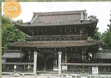
城端 城端別院 善徳寺 蓮如上人の開基から530年余りの古刹。本尊は行基作と伝えられる阿弥陀如来像。宝物収蔵館では貴重な古文書や宝物が見学できます。