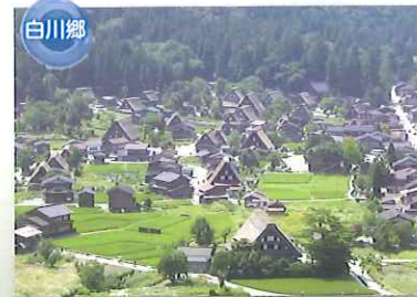
白川郷 世界遺産 白川郷合掌造り集落 世界遺産に登録された3集落の中では最も大きな集落です。集落の全域に山麓の林の一部を含む約45.6haが重要伝統的建造物群保存地区として保存され、歴史的景観が維持されています。