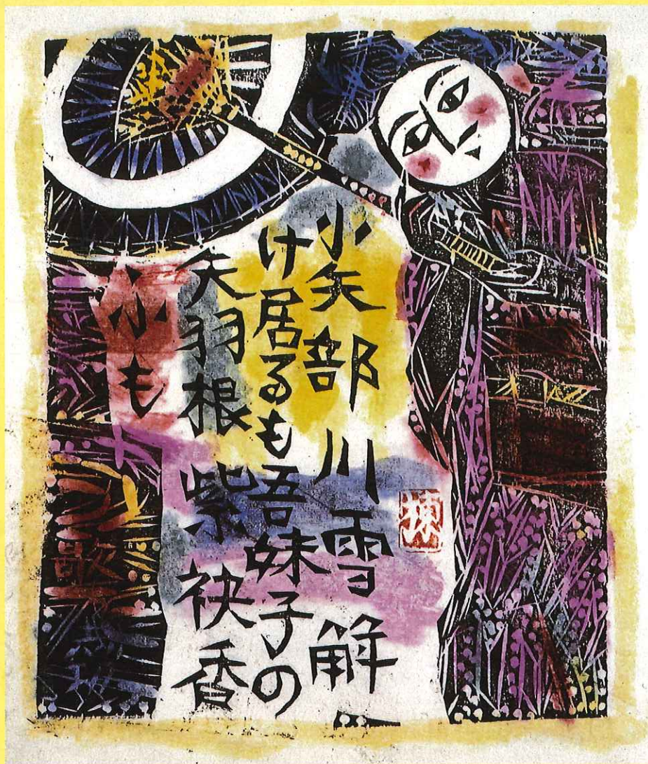
紫袂の柵 (福光美術館蔵)