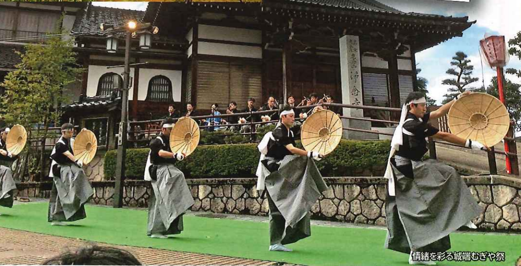
情緒を彩る城端むぎや祭