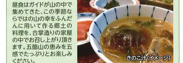
きのこ汁(イメージ)

五箇山の自然や文化、歴史に詳しい地元のガイドによる、散策ウォーキング!五箇山の豊かな自然を愛でながら、ガイドが解説する五箇山の奥深い文化や歴史の魅力も楽しめます。地元ガイドと歩くからこそみえてくる"五箇山の魅力"を存分にお楽しみください。