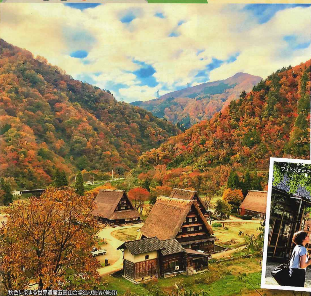
秋色に染まる世界遺産五箇山合掌造り集落(菅沼)