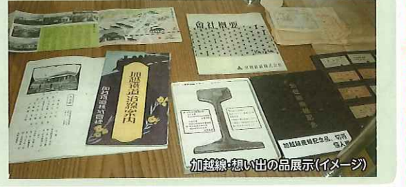
加越線:想い出の品展示(イメージ)

●名物ガイドによる廃線・加越線の解説 ツアーでは、今も残る旧井波駅を訪れ、加越線資料保存会メンバーのガイドが詳しく加越線について解説。また、当日は貴重な資料等の展示もあり、往時の様子に深く想いを馳せて頂けます。