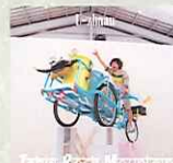
Tabla Rock Mountain 2018.4.21 Release アナログ盤：HRLP111

1977年生まれ。タブラ奏者。 18歳の頃にインドの打楽器・タブラと出会い、世界的タブラ奏者のオインド・チャタルジー、ザキール・フセイン両氏に師事。修行のため毎年インドに長期滞在するようになる。以降、インド音楽の演奏はもちろん、ASA-CHANG&巡礼やレイ・ハラカミ、蓮沼執太、ハナレグミなど、ジャンルを超えたコラボレーションに参加。2019年8月、9月にはあいちトリエンナーレにて、1日10時間の厳格なタブラ修行を40日間続ける『Chilla: 40 Days Drumming』の様子を一般公開予定。 www.u-zhaan.com