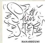
SHINJITERU 2017.10.25 Release VICL64847

1974年11月27日、東京生まれ。 高校2年の頃よりアコースティック・ギターで弾き語りをはじめ。1997年、SUPER BUTTER DOG でメジャー・デビュー。2002年夏より、バンドと併行してハナレグミ名義でひっそりとソロ活動をスタート。これまでに7枚のオリジナルアルバムをリリースしている。ソロ活動と併行して、東京スカパラダイスオーケストラ、BRAHMAN、レキシ、原田郁子ほかと多数のコラボレーションや、是枝裕和監督映画「海よりもまだ深く」に主題歌「深呼吸」と劇中音楽を提供するなど、その活動は多岐に渡る。 2018年からはタブラ奏者 U-zhaan とのユニットライブ「タカシタブラタカシ」、フジファブリックとのスペシャルユニット「ハナレフジ」などで積極的に活動中。 その深く温かい声と抜群の歌唱力を持って多くのファンから熱い支持を得ている。 www.hanaregumi.jp