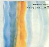
Marginalia II 2019.4.5 Release WPCS-13821

音楽家・映像作家 1979年生まれ 京都出身 長く親しんでいるピアノを用いた音楽、世界を旅しながら撮影した「動く絵画」のような映像、両方を手掛ける作家。『おおかみこどもの雨と雪』『夢と狂気の王国』『バケモノの子』『未来のミライ』の映画音楽をはじめ、CM音楽、執筆など幅広く活動している。 最新作は、自然を招き入れたピアノ曲集『マージナリア』、6年間のエッセイをまとめた書籍『こといづ』。 www.takagimasakatsu.com