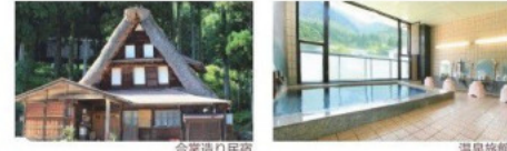
合掌造り民宿 温泉旅館