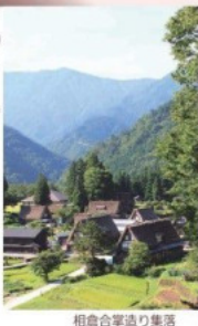
相倉合掌造り集落