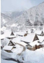
菅沼合掌造り集落